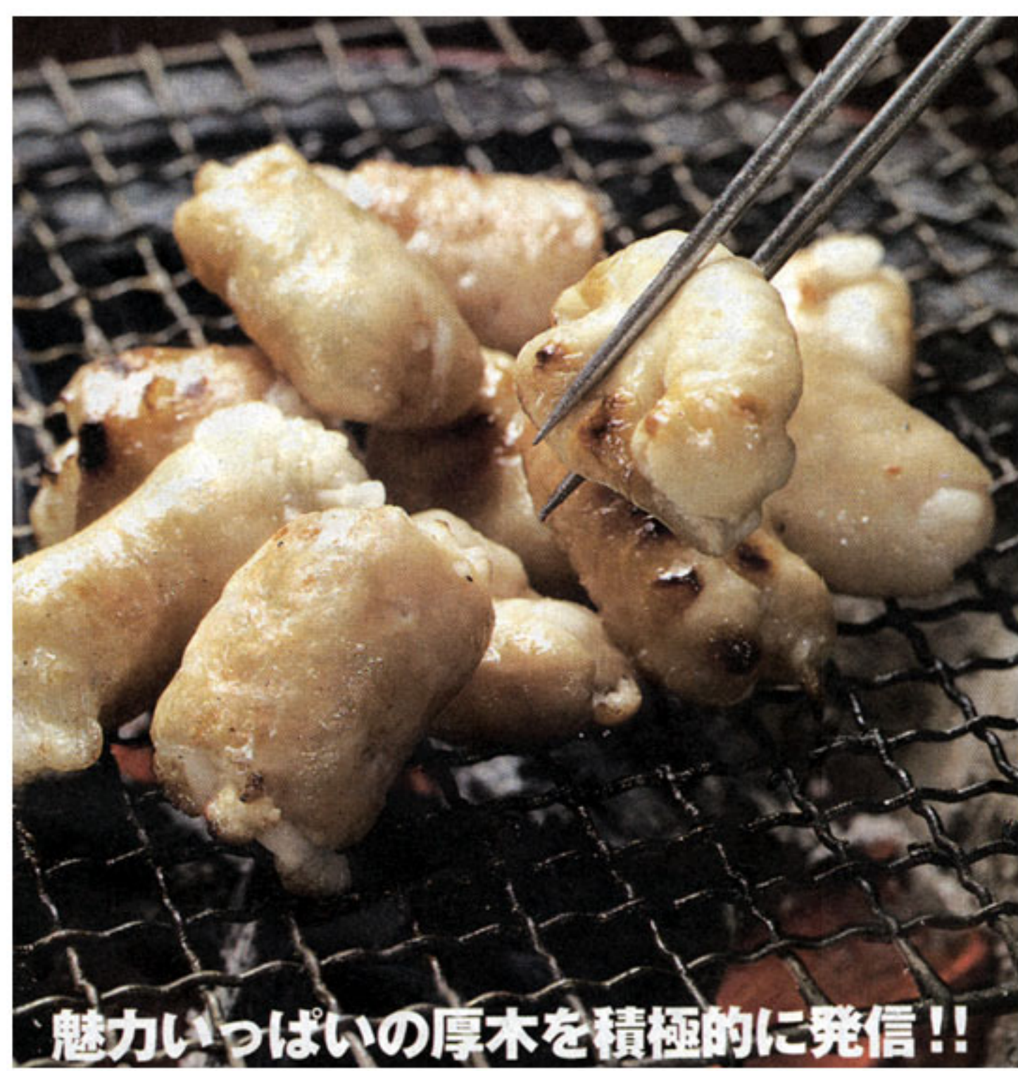
魅力いっぱいの厚木を積極的に発信!!

厚木の元気、まずは「食」から 小林 厚木市では、昨年 特色を積極的にPRするた 取り組みの一つとして、厚木 4月からシテイセールス推 進、さまざまな視点からシ の食文化の探求から始めよう 進歩を新たに設け、市の持つ ティセールスを行う戦略な と、新たに「あつぎ食プラン ている魅力や他都市にない とを検討しています。その 「ド」の認定を進めています。